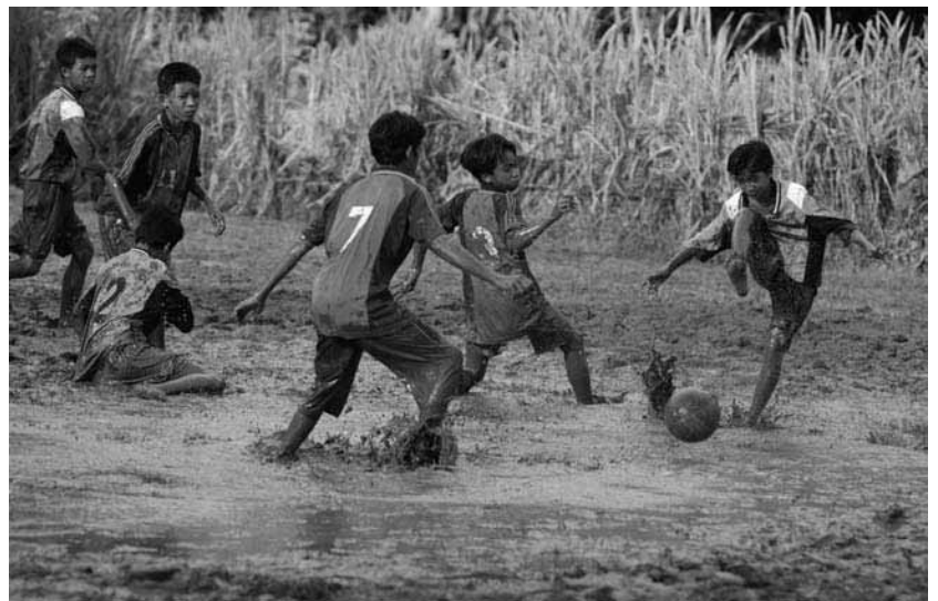
Fußball spielt man überall auf der Welt