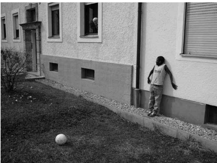
Straßenfußball in Deutschland (Platz 4)