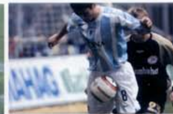
5. Preis: Christoph Glaser, „Upps“.

Im Januar 2006 hatten 200 deutsche Volkshochschulen den bundesweiten Fotowettbewerb „Der Klick vom Kick“ ausgeschrieben. Bis zum Einsendeschluss am 9. April 2006 wurden 1750 Fotos eingereicht. 48 Fotos gingen bei der „Volkshochschule im Norden des Landkreises München e.V.“ ein.